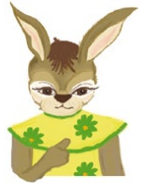
2. Gebärde: BEI MIR