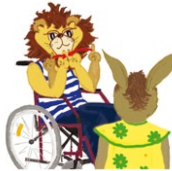
1. Gebärde: WIR TREFFEN UNS